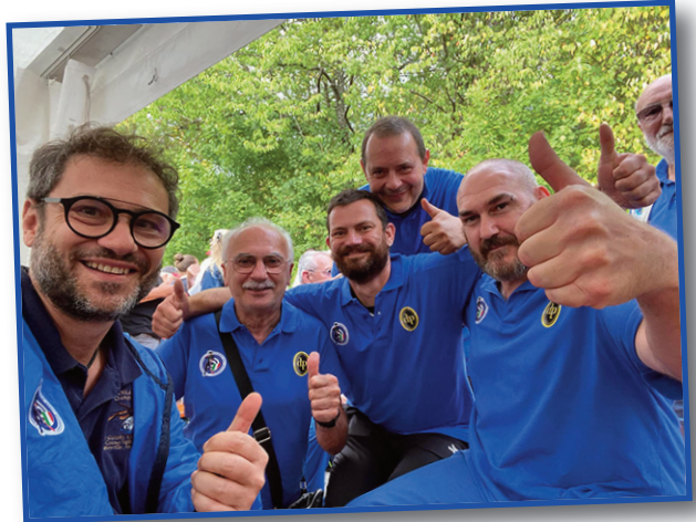
Mondiale di tiro Long Range di avancarica.

Ma CNDA non è solo questo. Puntiamo ad allargare la diffusione del tiro a polvere nera in Italia e in questo contesto si inserisce l'organizzazione del corso di tiro Long Range (fino a 1000 metri) che si è svolto il 29 e 30 ottobre nel campo di tiro di Cascina Legra in provincia di Pavia.