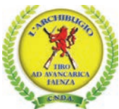
Le foto continuano nella pagina successiva