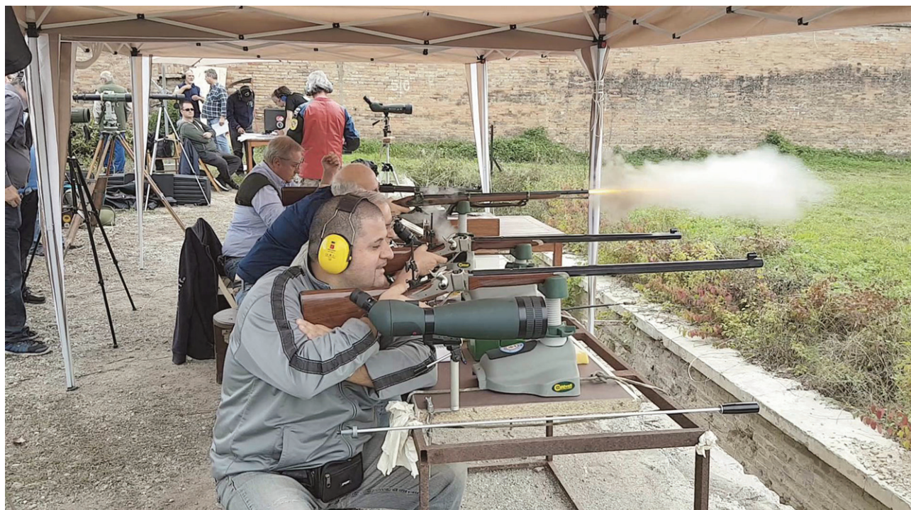
le foto continuano nella pagina successiva