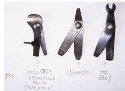
(da sinistra a destra attrezzo Trapdoor - Sharps - Mod.1863)

Chiedo per ciascuno euro 45. Massimo Capone 338.8510997 massimocapon@tiscali.it (foto sotto)