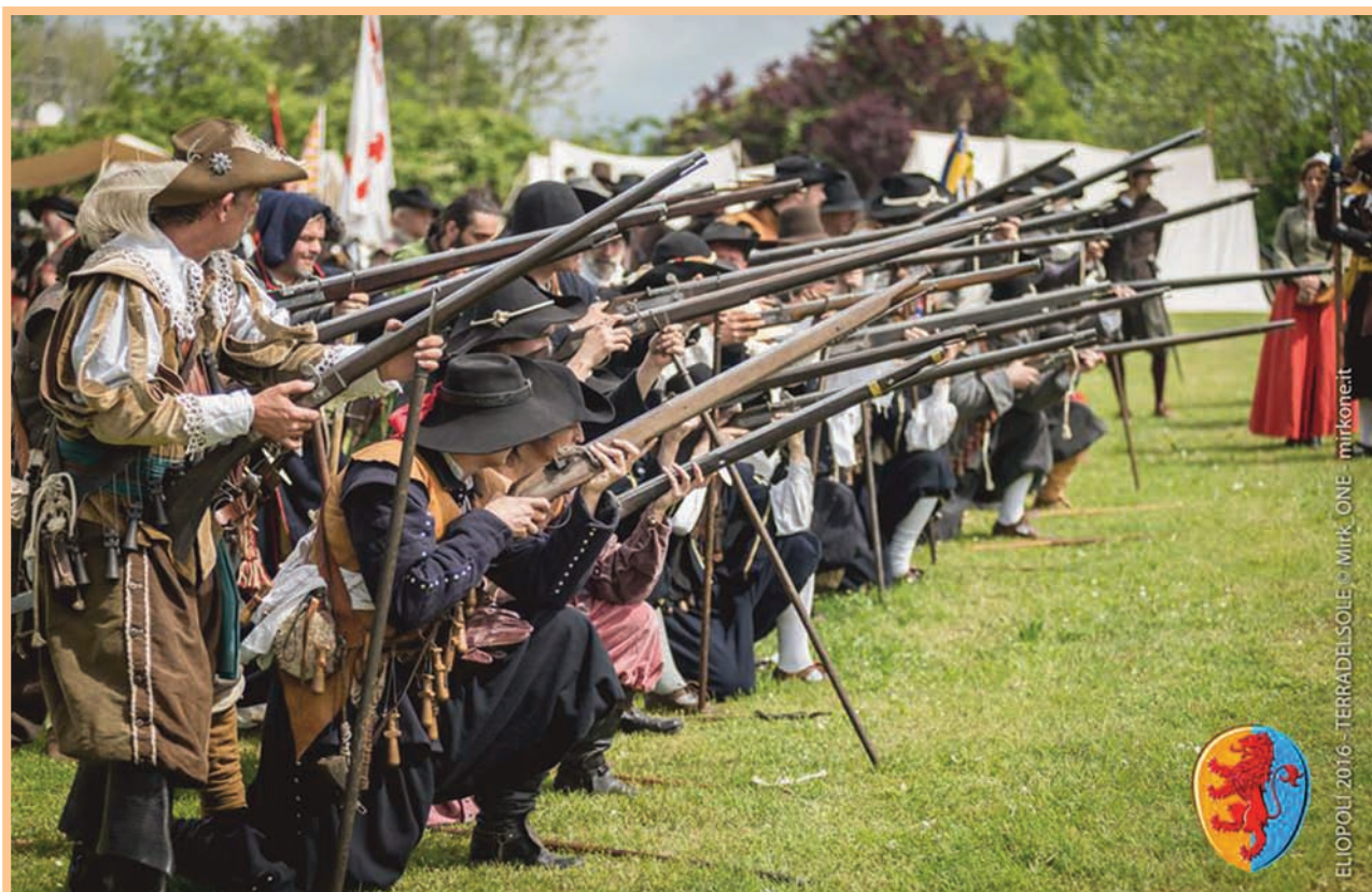
ELIOPOLI-2016 - TERRADELSOLE © MIRK_ONE - mirkone.it